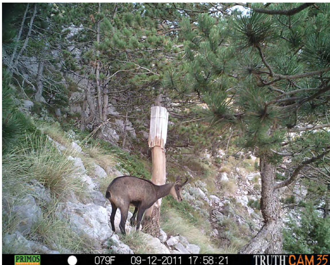
Slika 1: Fotografija divokoze sa lokacije „Sinjal“ Figure 1: Photo of chamois from the location „Sinjal“

crvenom bljeskalicom dometa do 12 m, i senzorom za pokret koji aktivira istu. Kamere su bile postavljene 30 do 150 cm iznad tla, i konstantno uključene u razdoblju od 27 dana na tri lokacije (Tablica 1). Lokacije su se nalazile na južnim padinama planine, prva kamera na lokaciji Sinjal bilježila je kretanje divokoza uz aktivno solište (Slika 1), dok su druge dvije kamere na lokacijama (Vlaka i Lokva) bilježile kretanje uz pojilišta. Obrada dobivenih podataka izvršena je uz pomoć Microsoft SQL Server (Microsoft®, 2008).